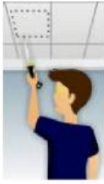
FIGURA (1) FAZER A MARCAÇÃO ONDE SERÁ FEITO O RECORTE DO NICHÔ.