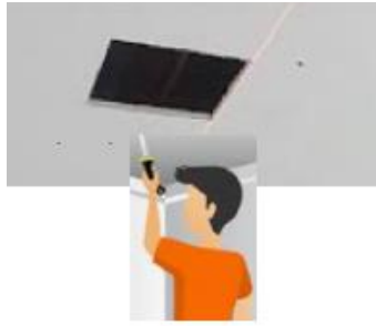
FIGURA (2) FAZER O RECORTE DA SUPERFÍCIE JÁ DEMARCADA.